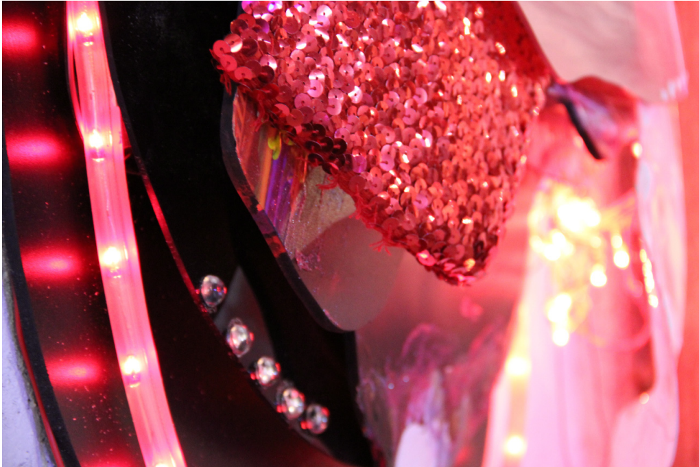
François Pourtaud, Sans titre , objet, détail, 2016