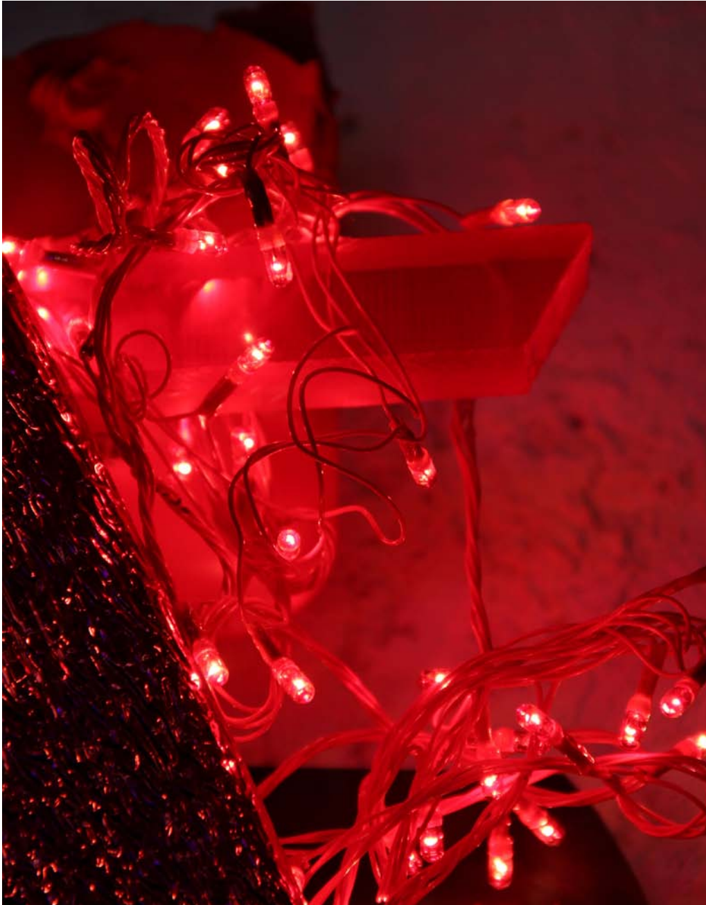
François Pourtaud, Sans titre , objet, détail, 2016