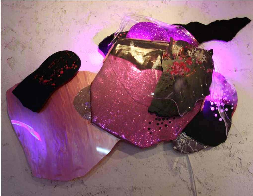
François Pourtaud, Sans titre , objet, 2016