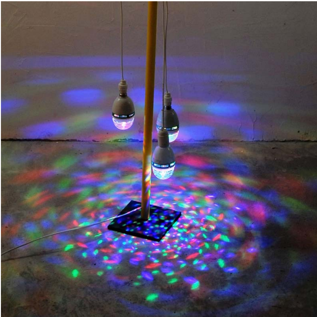
François Pourtaud, Sans titre , installation lumineuse, 2016