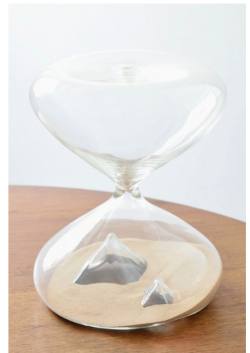
Céline Cléron, Le repos en Egypte , 2013, verre soufflé et sable, 40 cm x 25 cm (diamètre)