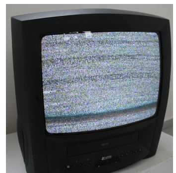
Nicolas Aiello, Neige , 2010, dessin animé en boucle (4 min) réalisé à partir de 25 dessins à l'encre de la série Berlin